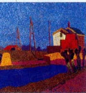
Bremmer Paysage di Paul Signac.